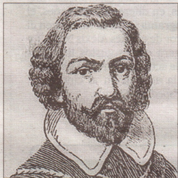
Juan Rodríguez Cabrillo.

Una historiadora cree que el primer europeo que pisó la Costa Oeste de EE UU era español