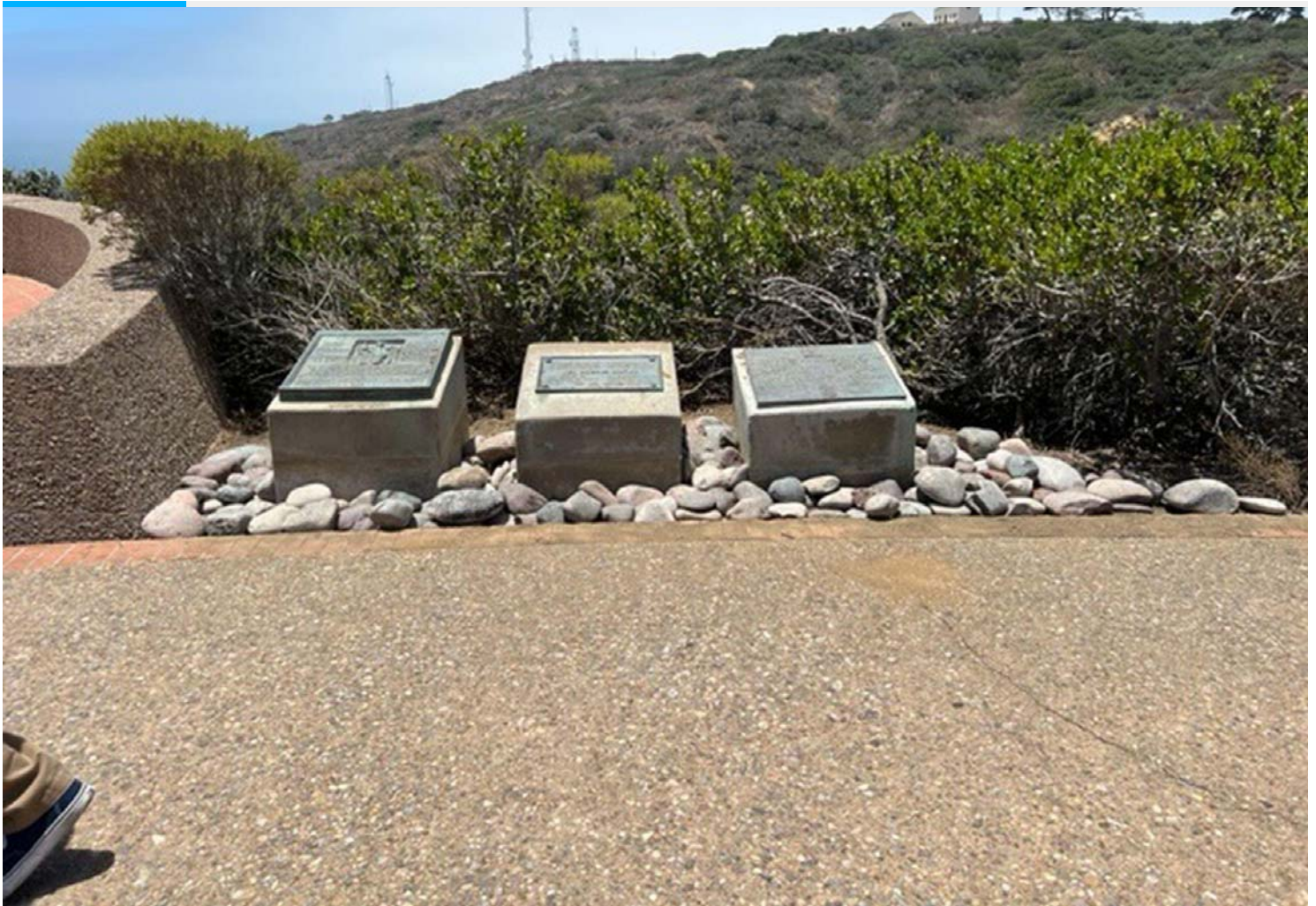
Tres de las placas que quedan en el Monumento Nacional de Cabrillo. Dos ellas hacen referencia a su origen portugués.

Engstrand reclama también al Congreso norteamericano “corregir el error” que ya aclaró la investigadora Susan Collins en su An Embarrassment of Riches. The Administrative History of Cabrillo National Monument (Una vergüenza de riquezas), “donde se demuestra que el Servicio de Parques Nacionales tergiversó la historia y el patrimonio solo para que los portugueses locales patrocinasen un festival” en el monumento a Cabrillo.