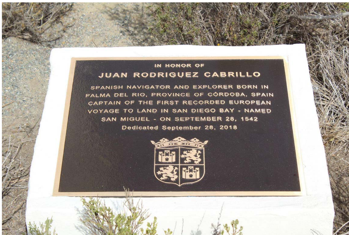
CASA DE ESPAÑA EN SAN DIEGO

Las autoridades del Cabrillo National Monument han devuelto a la Casa de España en San Diego, por la presión de la comunidad portuguesa, la metopa que recordaba las raíces cordobesas del navegante que exploró la costa oeste de EE UU